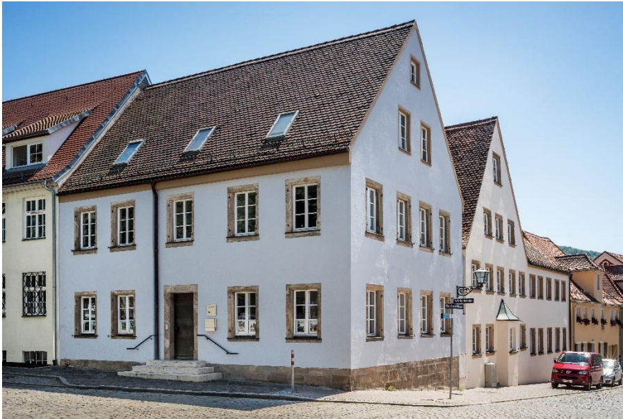
Dienststelle des Bayerischen Landesamtes für Denkmalpflege in Weißenburg