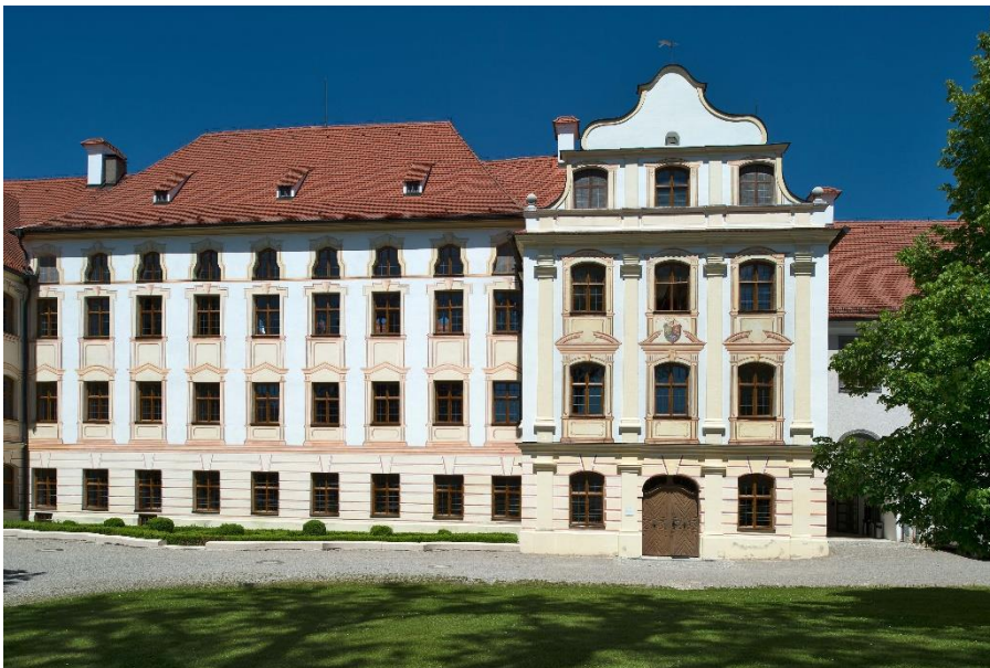
Dienststelle des Bayerischen Landesamtes für Denkmalpflege in Thierhaupten