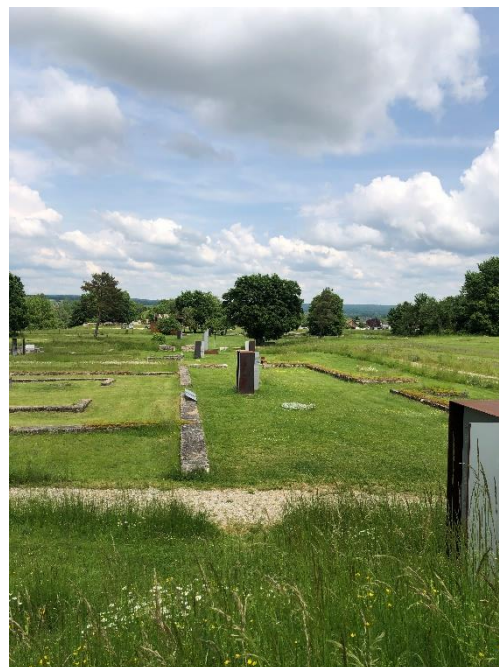
Rundwanderung in Eining