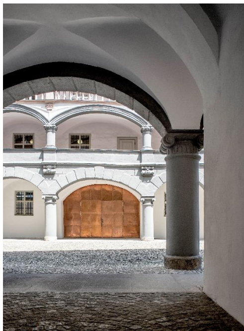
Innenhof der Alten Münze in München

Zur aktuellen redaktionellen Berichterstattung stellen wir Ihnen gerne Bildmaterial zum Download unter www.blfd.bayern.de/blfd/presse zur Verfügung. Bei einer anderweitigen Nutzung bitten wir Sie, selbständig die Fragen des Urheber- und Nutzungsrechts zu klären.